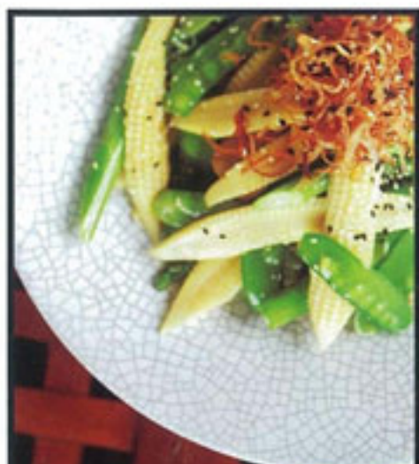
上图起顺时针： 度假村内的 spa 健康餐，La Trotteria 餐厅，在泰国南部 的岛屿上，洋溢遥远的地中 海气息；Angsana Spa 内寂 静生长的植物。左页左图 起：Banyan Tree Phuket 双泳 池别墅内的新婚卧室，花团 锦簇的结婚典礼