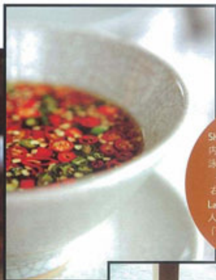
下图起顺时针： Sheraton Grand Laguna Phuket 内，有亚洲最长的泳池，配有 泳池酒吧，演奏传统乐器的乐 手，传统的酸辣泰式调料。 右页左图起，Sheraton Grand Laguna Phuket 3.2 公里长的私 人沙滩，是举办露天宴会的热 门选择，Laguna 度假村掩映 在热带树林之中。